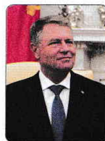
Klaus Werner Iohannis