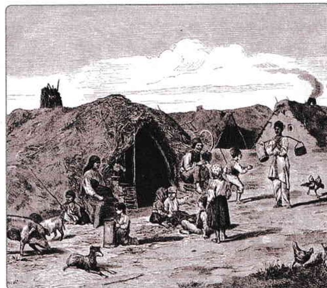
Condițiile de viață ale romilor eliberați