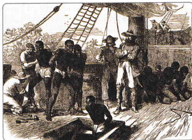
Comerț cu sclavi în perioada colonială